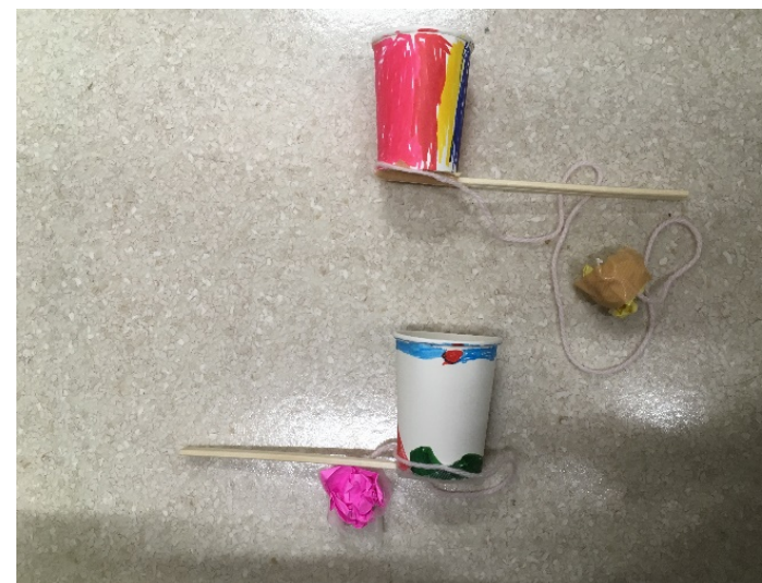
→ カラフルな紙コップ剣玉