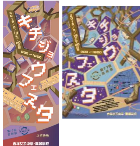
↑今年度吉祥祭チケット(左)と ポスター(右)