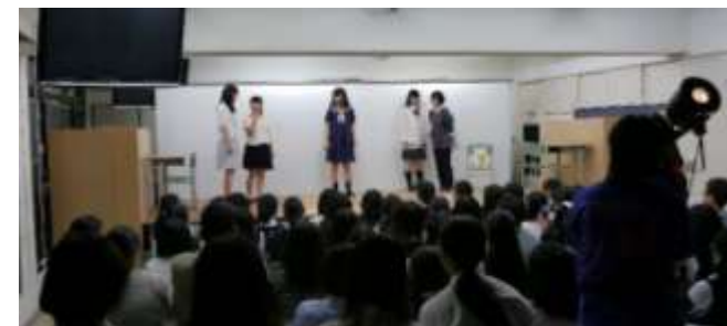
↑ 昨年度の小劇場の様子