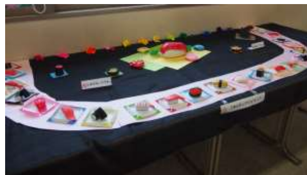
← 過去の吉祥祭における装飾の例