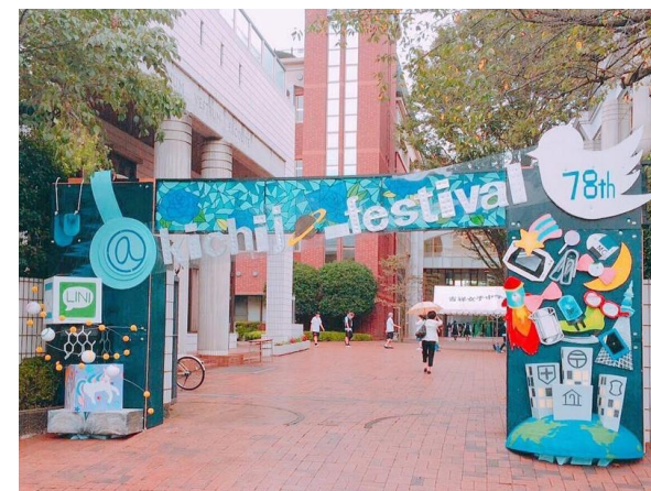
↑ 昨年度のゲートの様子