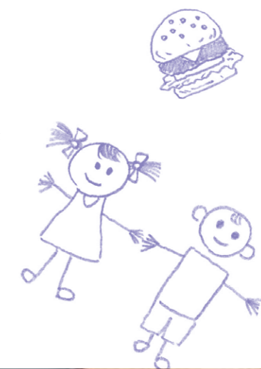
カナダ語学体験ツアー(中3) 毎年10月~11月に9日間の日程で、姉妹校であるQueen Margaret's School(QMS)を訪問。

吉祥では放課後に、教養を深め技能を高める目的で多彩な講座を開講しており、希望者は履修することができます。国際人として日本文化を発信するためにも身につけておきたい華道や茶道をはじめ、バレエやピアノなどのお稽古事、語学を磨くための英会話や中国語、また、芸術系を希望する生徒にも対応した音楽や美術の講座もあり、中学1年から専門の先生に習うことができます。家に帰って、改めて習い事に出かける必要がないため、時間を有効に使えます。週1回のもので、部・クラブ活動との両立も可能です。