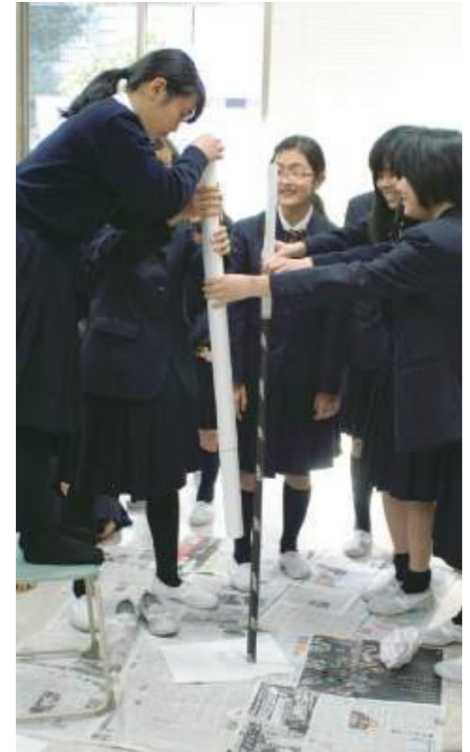
ライフスキル・プログラム「卵を守れ」 生卵を2m落下させても割らずに受け取れる容器をつくります。協働作業を通じ、他者とのコミュニケーションを学びます。