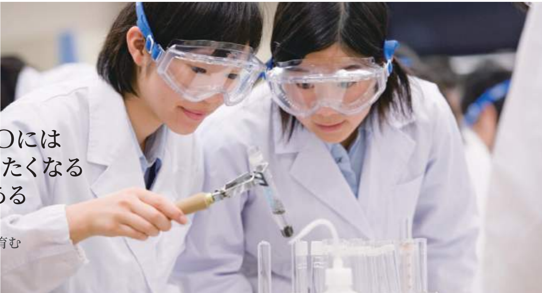
理科実験授業 実験・実習が充実した理科の授業。自然現象のプロセスを自分たちの目で確認し、そこにある原理を考えていきます。