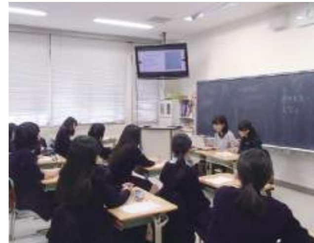
卒業生を囲む会(高2) 現役大学生や大学院生から聞く大学生活の話は、進路選択のヒントや受験勉強の励みになります。