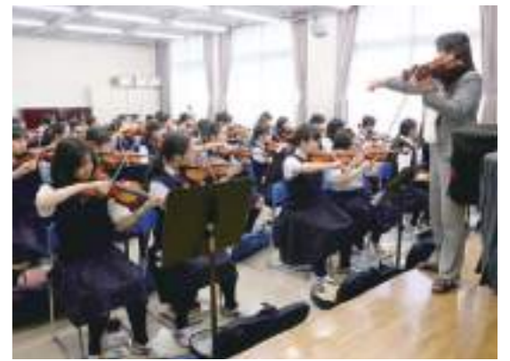
中学音楽 中学音楽ではヴァイオリンに挑戦する機会があります。