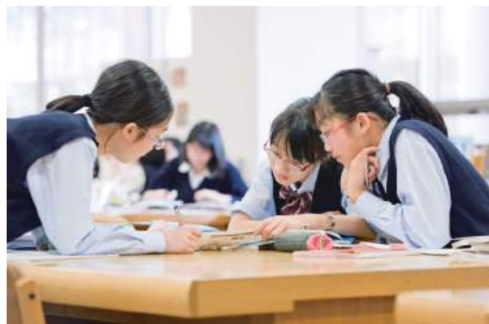
主体的な学びを重視 資料収集やグループ学習などは、さまざまな教科で取り入れています。