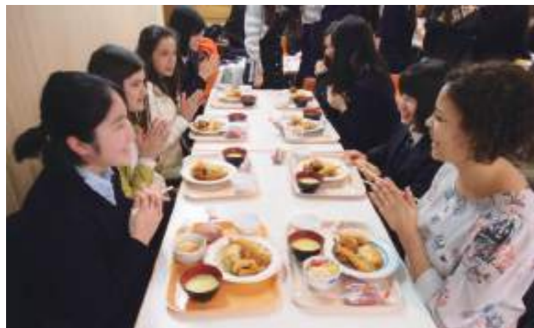
MPS短期留学生受け入れ 吉祥での学校生活を共に過ごします。