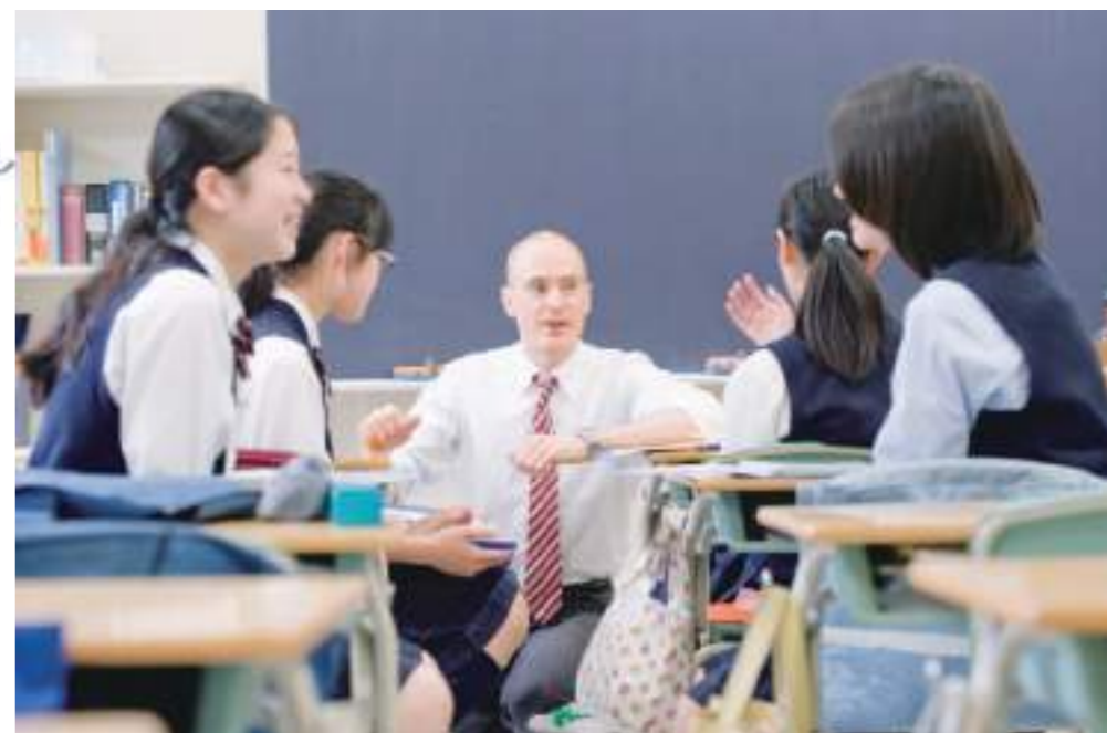
中学英会話 1クラスを2分割した少人数制。中1・中2は週に1時間、中3は週に2時間行われます。