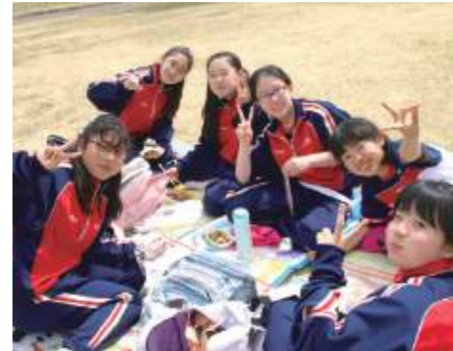
新入生オリエンテーション(中1) 入学後すぐ富士吉田キャンパスで行う1泊2日のオリエンテーションでは、さまざまな活動を通して仲間づくりを行います。