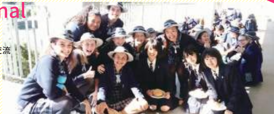
夏休みオーストラリアツアーでIGGS生と共に。