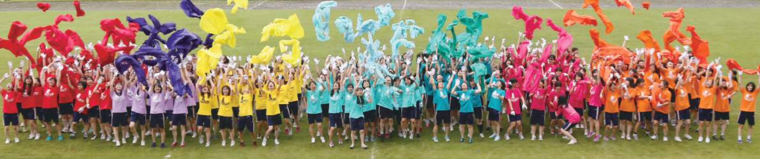
色とりどりの布を高く舞い上げ、思わず上がる「KICHIJO、サイコー！」の声。運動会の名物、半年かけて練習した高校3年生全員によるダンスは圧巻。