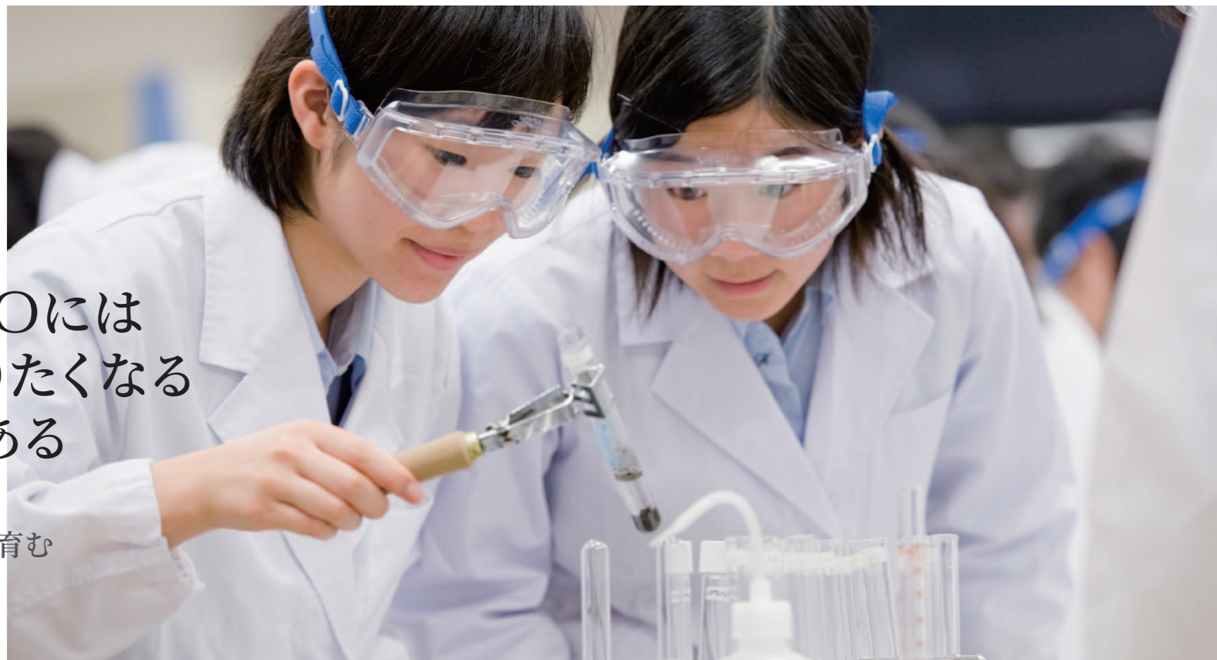
理科実験授業 実験・実習が充実した理科の授業。自然現象のプロセスを自分たちの目で確認し、そこにある原理を考えていきます。