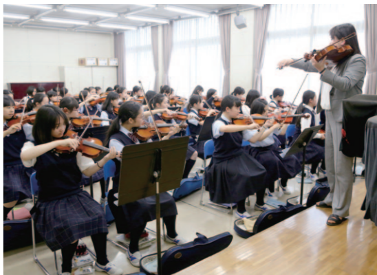
中学音楽 中学音楽ではヴァイオリンに挑戦する機会があります。