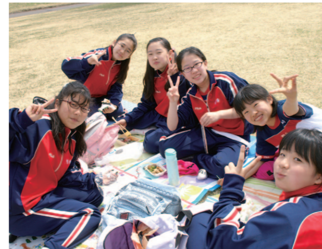
新入生オリエンテーション(中1) 入学後すぐ富士吉田キャンパスで行う1泊2日のオリエンテーションでは、さまざまな活動を通して仲間づくりを行います。