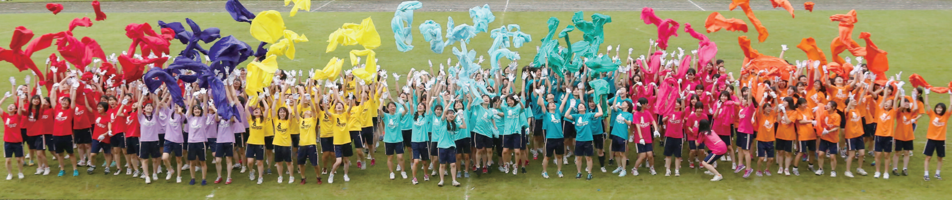
色とりどりの布を高く舞い上げ、思わず上がる「KICHIJO、サイコー！」の声。運動会の名物、半年かけて練習した高校3年生全員によるダンスは圧巻。