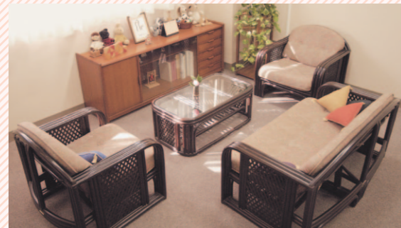
月曜日から土曜日までカウンセラーが常駐し、いつでも気軽に相談できます。