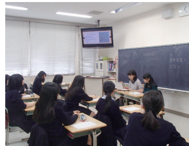
卒業生を囲む会(高2) 現役大学生や大学院生から聞く大学生活の話は、進路選択のヒントや受験勉強の励みになります。