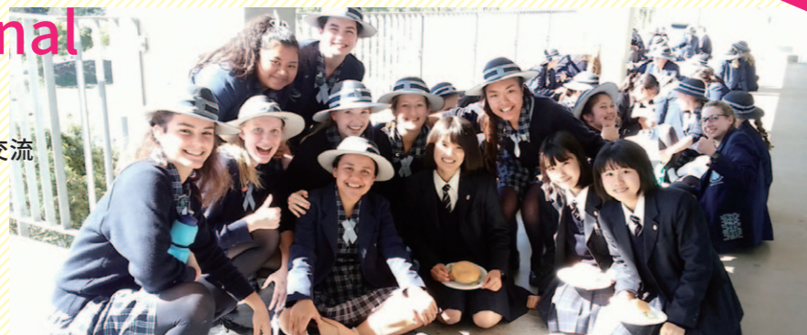
夏休みオーストラリアツアーでIGGS生と共に。