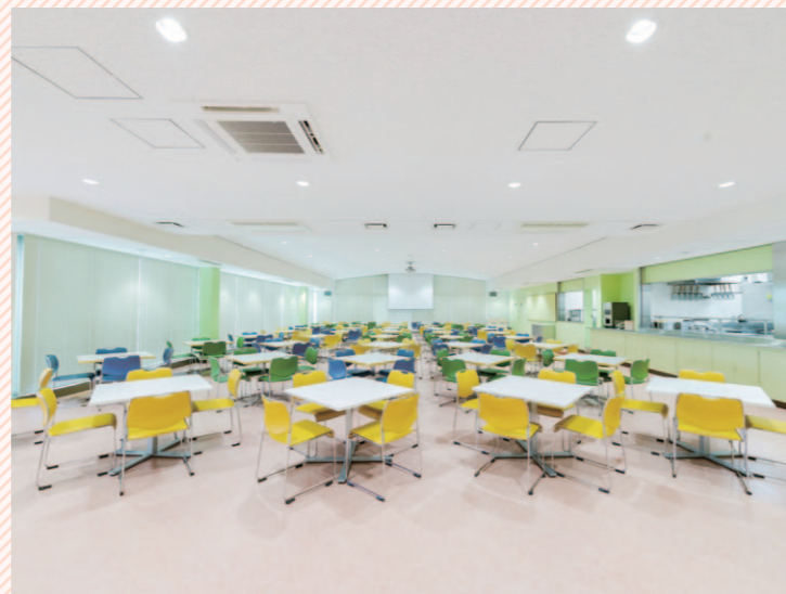
豊富なメニューがあり、生徒たちの憩いの場です。