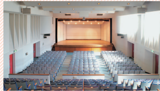
約400名収容。校内行事以外に講演会などにも使われます。