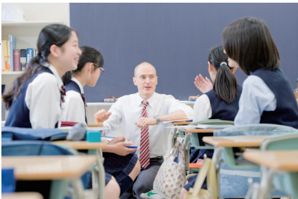
中学英会話 1クラスを2分割した少人数制。中1・中2は週に1時間、中3は週に2時間行われます。