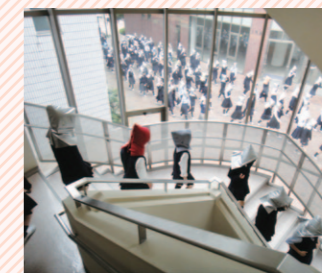
避難訓練のようす

本校では災害が起きた時、生徒の安全に対して「地震・防災対応マニュアル」に基づき全教員が対応するようにしています。また、災害の発生状況をホームルーム時、授業時、休み時間と別々に想定し、年3回の全校避難訓練と、教職員防災研修を行っています。保護者・生徒への連絡システムとしてはインターネットからアクセスできる緊急連絡サイトとメール配信システムにより、2通りの通信手段を確保しています。災害時の食料は生徒全員が学校に最低3日間避難生活を続けることができるように備蓄しています。