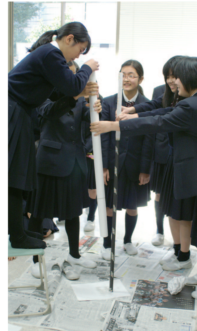
ライフスキル・プログラム「卵を守れ」 生卵を2m落下させても割らずに受け取れる容器をつくります。協働作業を通じ、他者とのコミュニケーションを学びます。