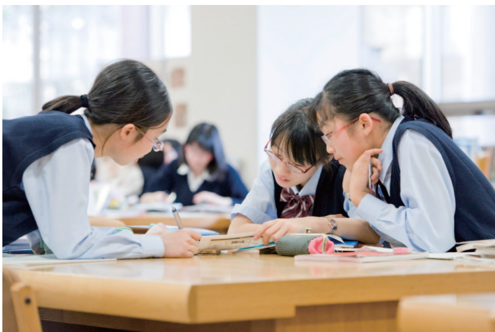
主体的な学びを重視 資料収集やグループ学習などは、さまざまな教科で取り入れています。