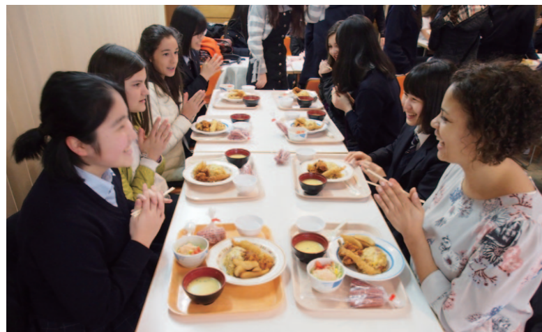
MPS短期留学生受け入れ 吉祥での学校生活を共に過ごします。